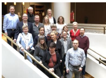
Bild från Nordiskt möte i Helsingfors Representanter från Finland, Danmark, Norge och Sverige.

I början av september var Vikings styrelse, tillsammans med Norges och Danmark föreningar för hjärt – Lungtransplanterade, inbjuden till ett nordiskt möte i Helsingfors av den finska föreningen SYKE. Under två dagarna vi hade vi möjlighet att bl.a. redogöra för och diskutera ländernas situation inom olika områden såsom medlemskap, kommunikation, lagstiftning och idrottsaktiviteter och vad som kan utvecklas framöver. Vi var alla eniga om att pandemin har lagt en hämsko över en stor del av verksamheten och alla hade tappat medlemmar pga. att det var omöjligt att ordna fysiska träffar av olika slag. Ett annat ämne som kändes viktig var att se hur möjligheten är att samordna de olika idrottsevenemang som anordnas på nationell, nordiskt och Europisk nivå. Diskussioner pågår och framtiden får utvisa vad man kommer fram till i de olika styrelserna ( EHLTFs och WTGs ). Vinningen av en samordning kan vara båda på det praktiska planet samt det ekonomiska då det blir allt svårare att hitta en bra finansieringen av de olika "spelen".